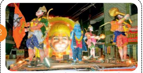
भगवान श्रीराम और भक्त हनुमान की...